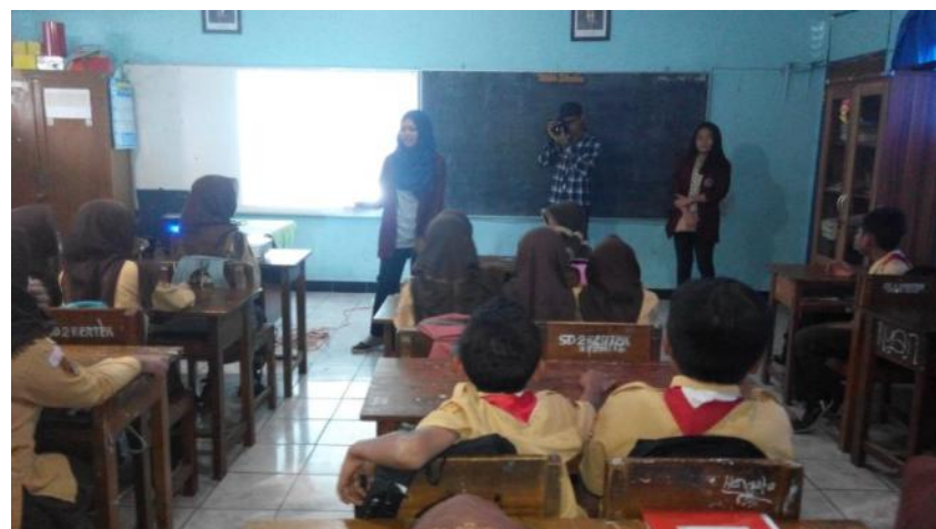
Pemutaran di kelas SDN 1 dan 2 Kertek