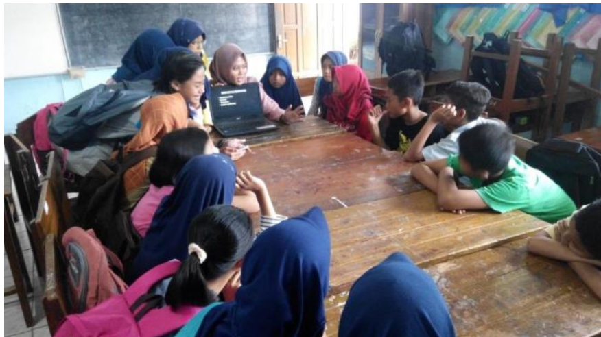
Materi dasar proses pembuatan film dan kru film