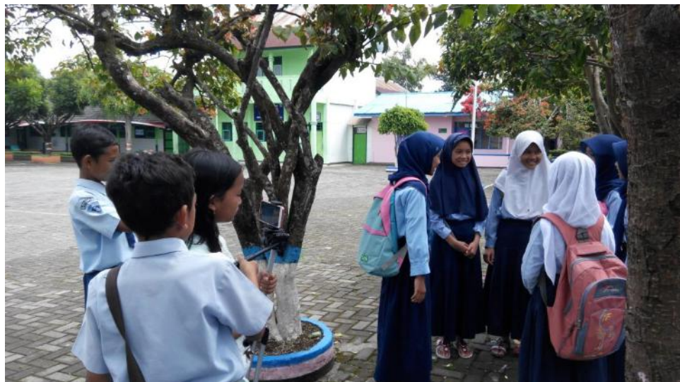
Proses Produksi Film Pendek Siswa