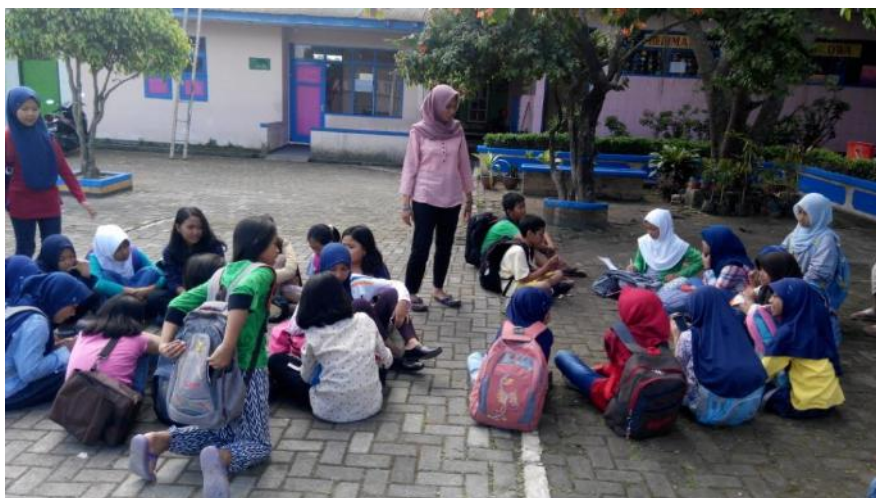
Pembagian kelompok dan pembuatan naskah