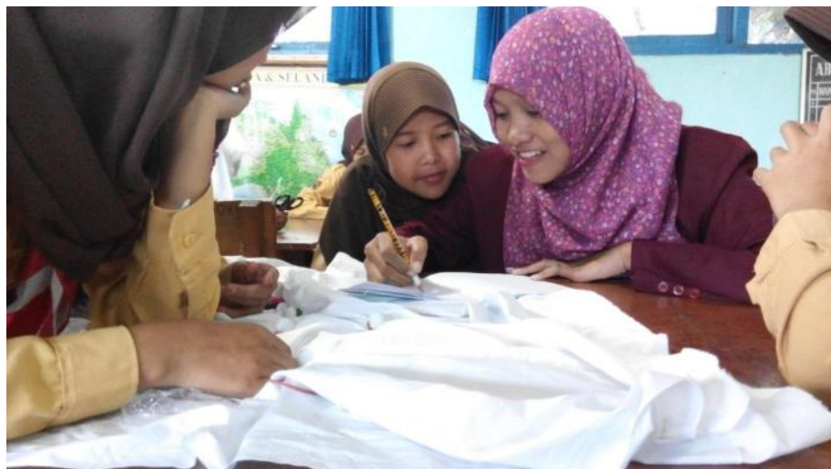
Dokumentasi kegiatan proker teman kelompok