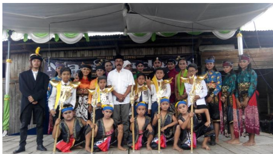
Dokumentasi perpisahan KKN "Sendra Tari"